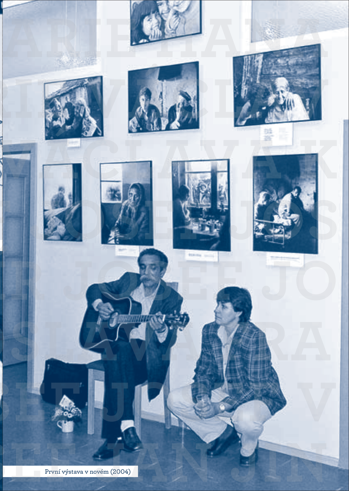
První výstava v novém (2004)