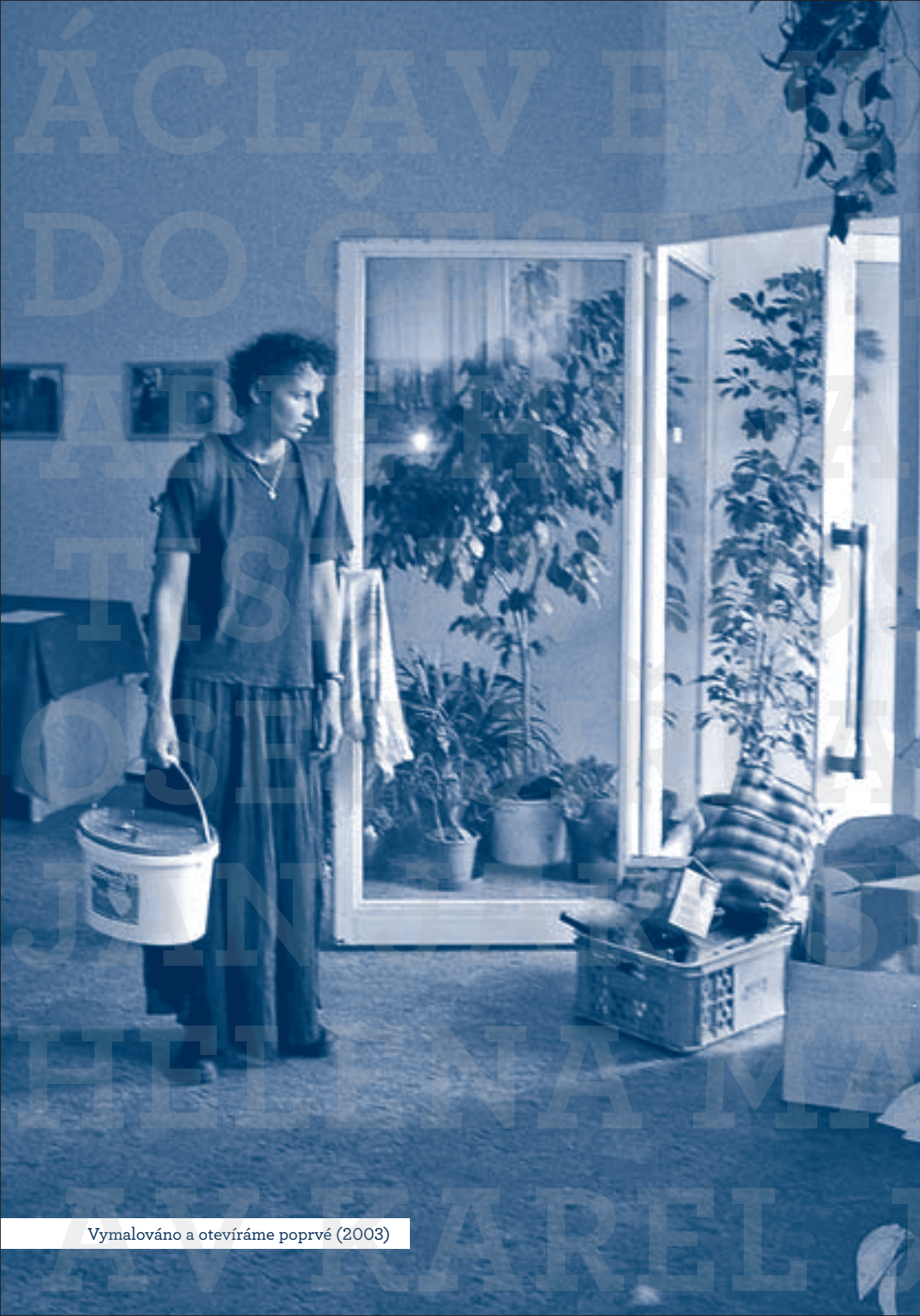
Vymalováno a otevíráme poprvé (2003)