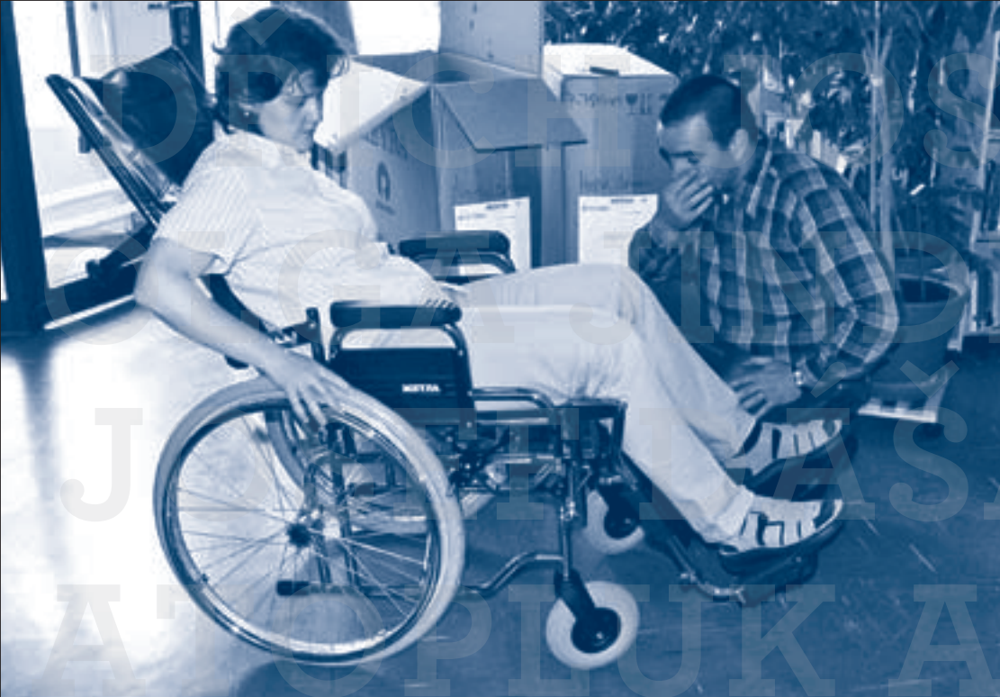
První dary do půjčovny / Tým hospice v roce 2005