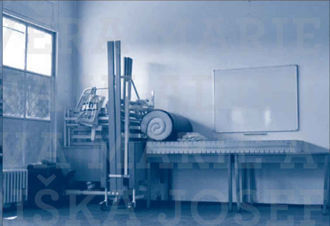
První postel (2003) / U prvních pacientů