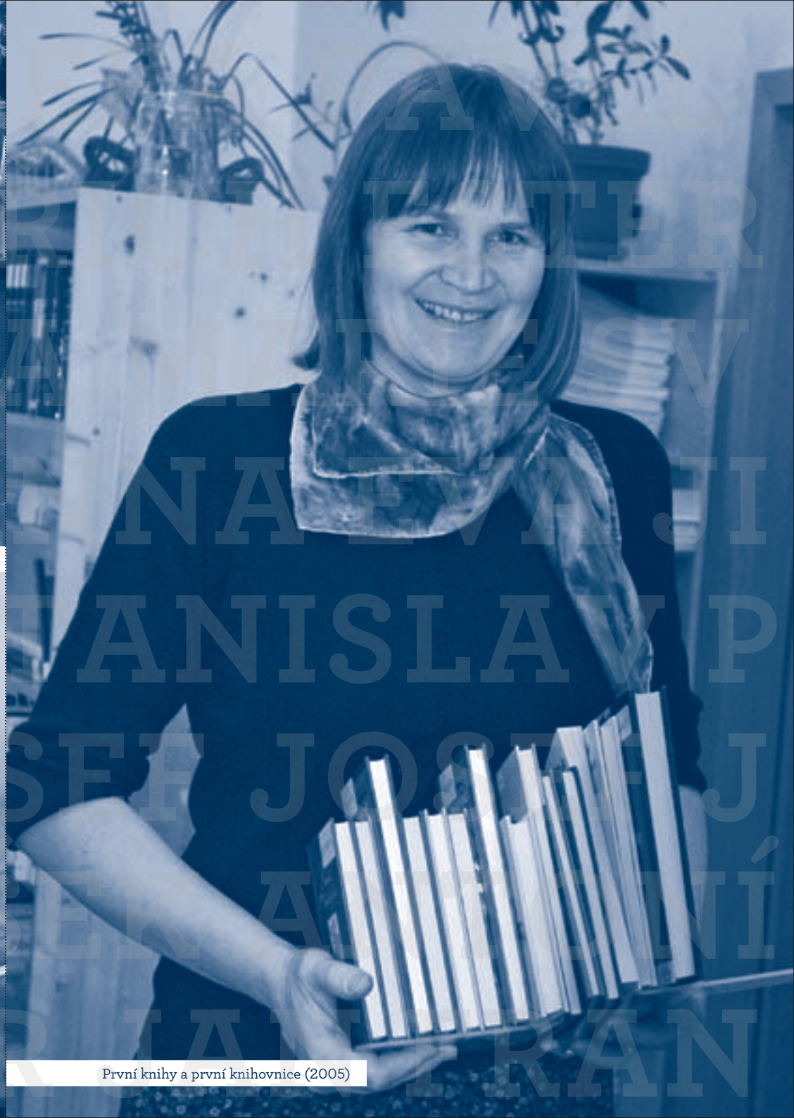
První knihy a první knihovnice (2005)