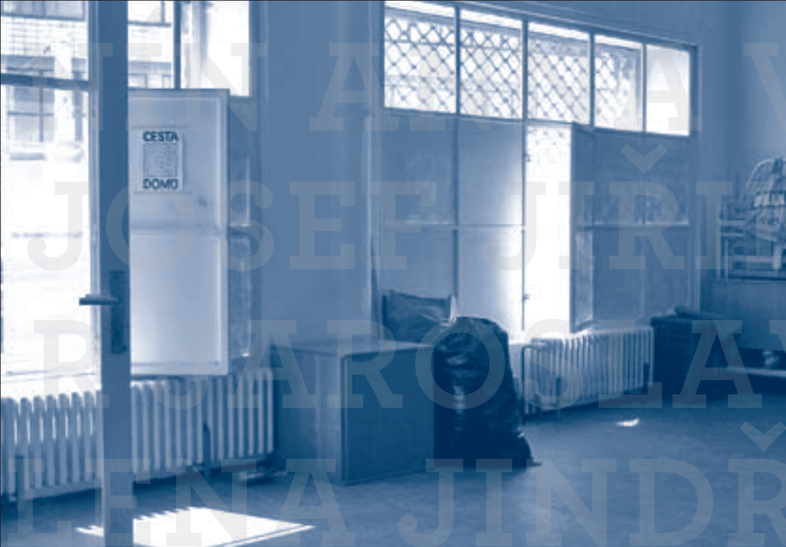
První cedule (2003) / Druhá cedule (2003)