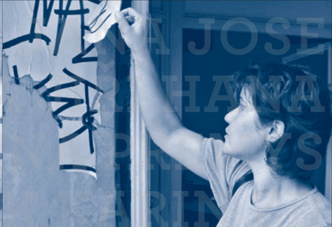
Začínáme (2003) / První den v prvním působišti