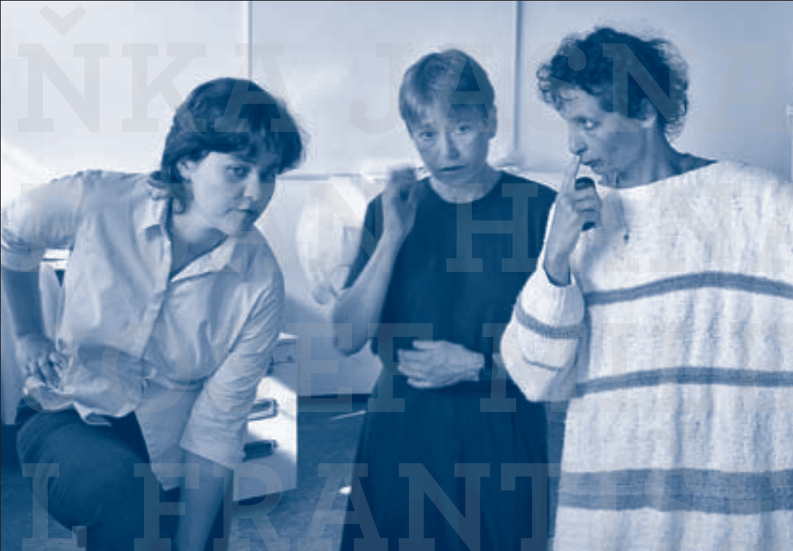
Lehce bláznivé zakladatelky (2003) / První benefiční akce v roce 2002