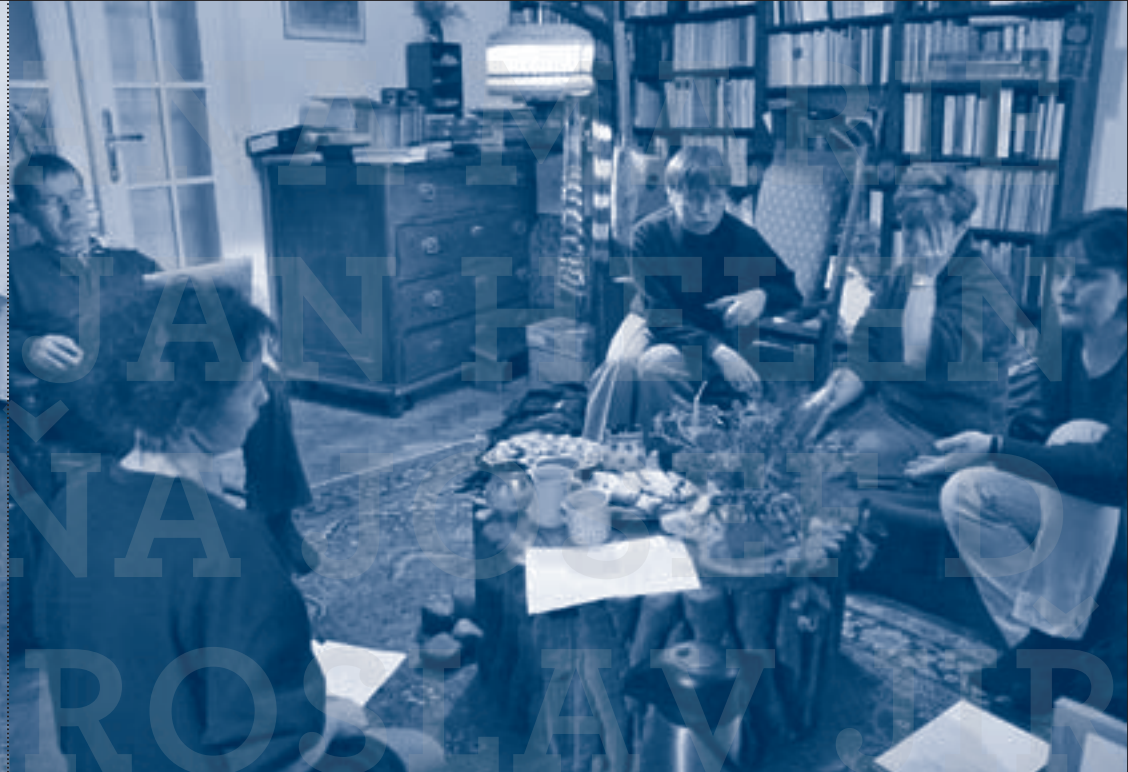
Rada u pařezu v roce 2004 / První sklad