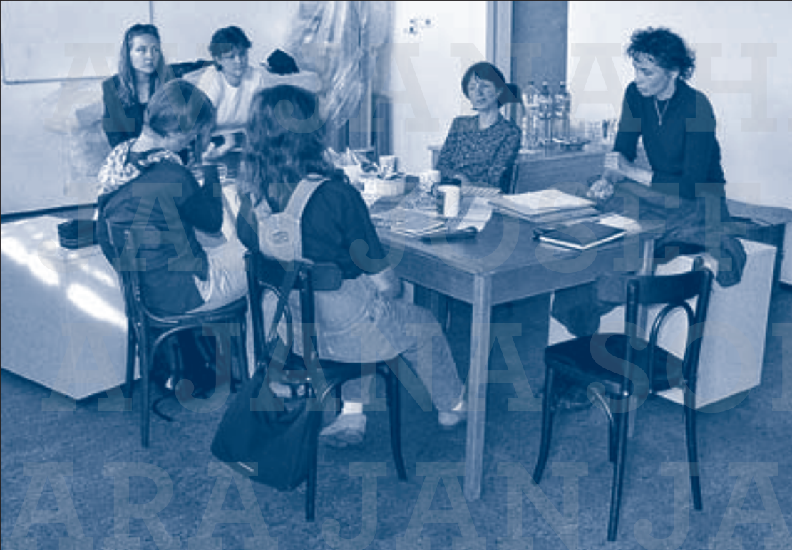
První tým (2003) / První skupinová fotografie Cesty domů (2004)