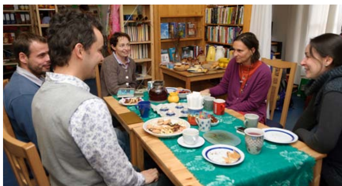
Adventní zastavení s dárči