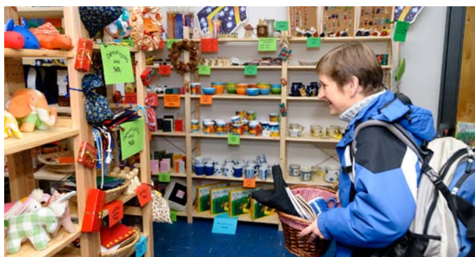
Krámeček na cestě domů potěší i pomáhá