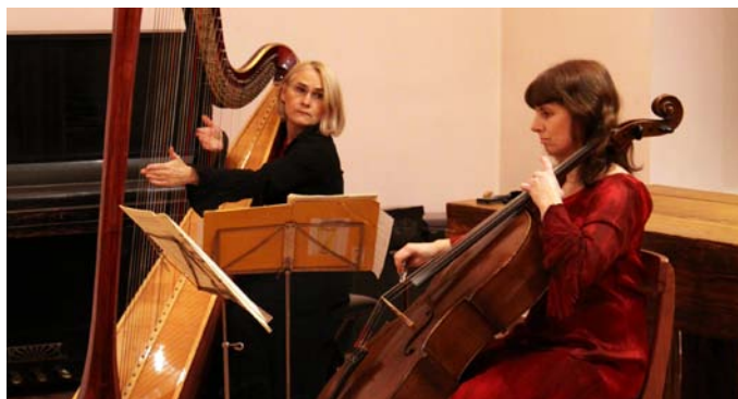
Na setkání pozůstalých nechybí krásná hudba

máhaly klientům při oblékání, podání stravy a hygieně, ale také svou přítomností a péčí zastupovaly rodinné příslušníky a další pečující, takže pro tyto těžce nemocné lidi nebylo třeba zajišťovat ústavní péči, ale mohli zůstat doma, mezi svými blízkými.