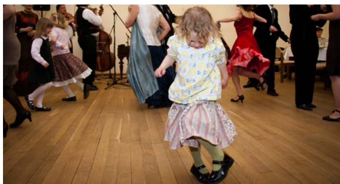
Z cimbálového plesu Cesty domů