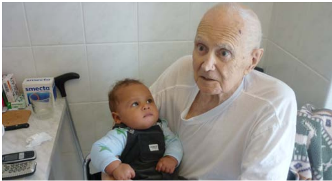
I děti umějí doprovázet