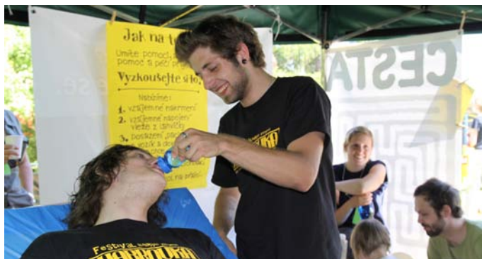
Cesta domů na Habrovce – zkuste si pečovat