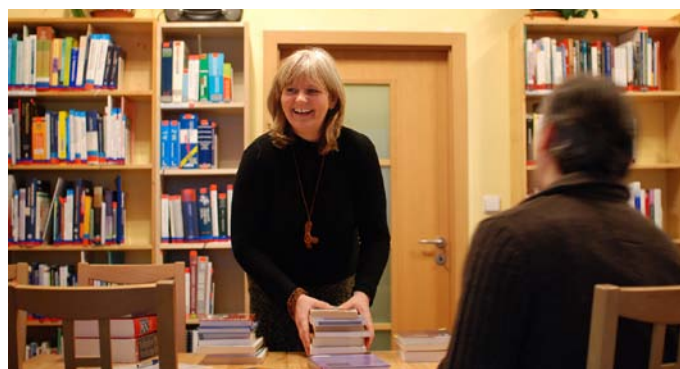
Knihovna Cesty domů je tu pro každého, přijďte!

rují a ve společnosti propagují Cestu domů a hospicovou myšlenku. Tradiční se stal také jarní cimbálový ples pro sponzory a další dobrodince Cesty domů, na kterém jsme děkovali dárcům a dobrovolníkům. Nově otevřený dobročinný obchod, Krámeček na cestě domů přináší podporu Cestě domů a nevtíravou osvětu. Lidé, kteří přicházejí koupit zajímavé a většinou ručně vyráběné dárky, se zároveň seznamují s tím, co to je hospic a jaký má význam. Krámeček prodával a propagoval naši činnost také na Vánočních trzích na Palackého náměstí. V listopadu byl opět v režii dobrovolníků zorganizován koncert u sv. Markéty v Břevnově a v prosinci jsme poprvé pořádali Adventní zastavení pro příznivce, dobrovolníky a dárcy, které se ukázalo být velmi milou a srdečnou příležitostí pro různá osobní setkání.