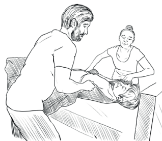
B. Pomocí podložky ve dvojici