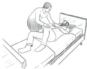
1. Vleže na zádech pokrčte nemocnému levou nohu.