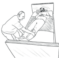
1. Posuňte na kraj lůžka nohy nemocného.