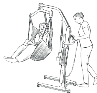
S velkými pomůckami (elektrický zvedák)