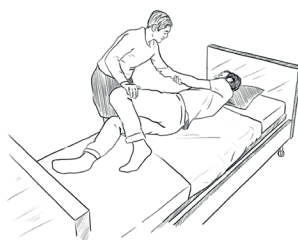
2. Otáčení na bok začněte tlačáním na pokrčené koleno nemocného a připojte tažení za jeho levou ruku.