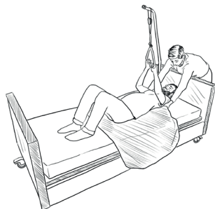
A. Pomocí podložky (Hodně pomůže náklon lůžka)