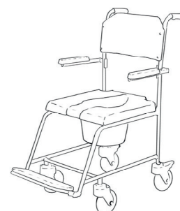
WC židle do sprchy

Po použití se dá jednoduše složit a uložit za skříň. Nosnost mívá 110 kg.