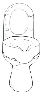
Nástavec na WC