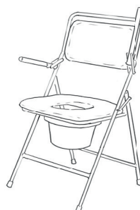
Nepojízdná WC židle skládací

Dává větší pocit jistoty při sedání. Výška sedu je nastavitelná. Nosnost mívá 120 kg.