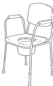
Nepojízdná WC židle

Je možné ji použít jako vozík po bytě, případně s ní zajet nad standardní toaletní mísu. Nosnost mívá 110 kg, případně 130 kg.