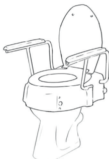
Nástavec na WC s madly