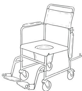
Pojízdná WC židle

Je možné ji použít jako vozík po bytě, případně s ní zajet nad standardní toaletní mísu. Nosnost mívá 110 kg, případně 130 kg.